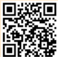
Instagram AWR KaufBar