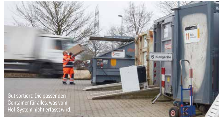
Gut sortiert: Die passenden Container für alles, was vom Hol-System nicht erfasst wird.

Beim Entladen Ihres Fahrzeuges können wir Sie nicht unterstützen.